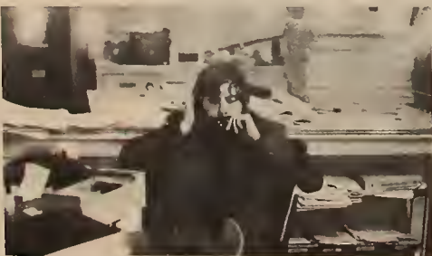
SUSK Office, Toronto, 1971.