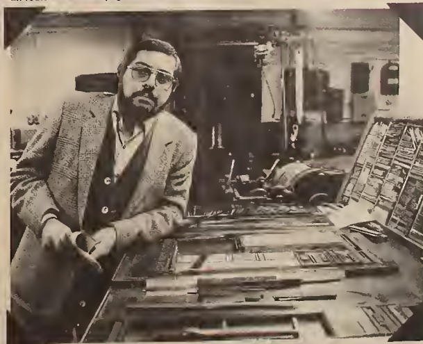
Ukrainian Echo, Toronto, 1983.