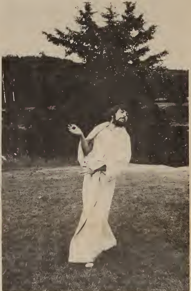
En route to the Winnipeg SUSK Congress, 1974

JULY/AUGUST 1984 • STUDENT • SUPPLEMENT 2