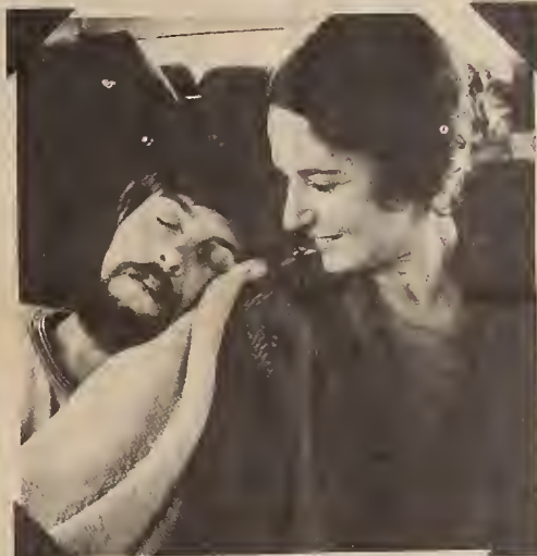
En route to the Winnipeg SUSK Congress, 1974